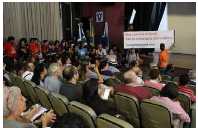
UNIRIO: comunidade acadêmica em defesa da autonomia universitária, contra as imposições do governo Bolsonaro.

Trata-se de mais um ataque contra a autonomia universitária. E mais um motivo para ampliar a organização e a mobilização dos trabalhadores e das trabalhadoras da educação.