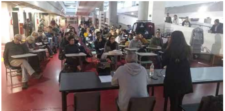
Assembleia de docentes da UFABC, 5 de junho

Fruto desse movimento cada vez mais amplo de resistência, o Comitê de Mobilização também teve seu papel reforçado nessa Assembleia. O Comitê, já criado em ocasião anterior, é um