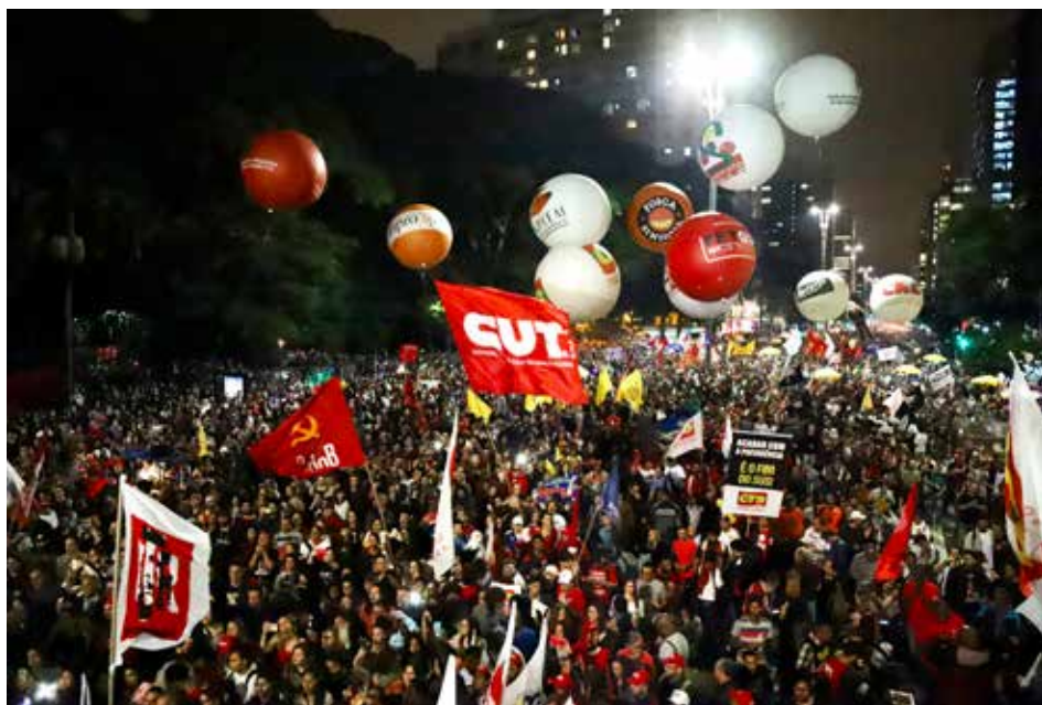
Ato em defesa da previdência, Av. Paulista, 22 de março de 2019

As duas principais mudanças propostas pela PEC 006/2019, entretanto, dizem respeito ao modelo de aposentadoria. No Brasil, a aposentadoria é tema constitucional; a PEC propõe tirar o assunto da Constituição. Hoje, a aposentadora pública é baseada no principal da universalidade e da solidariedade intergeracional. Todos os trabalhadores que estão na ativa contribuem para pagar as aposentadorias dos que já deixaram